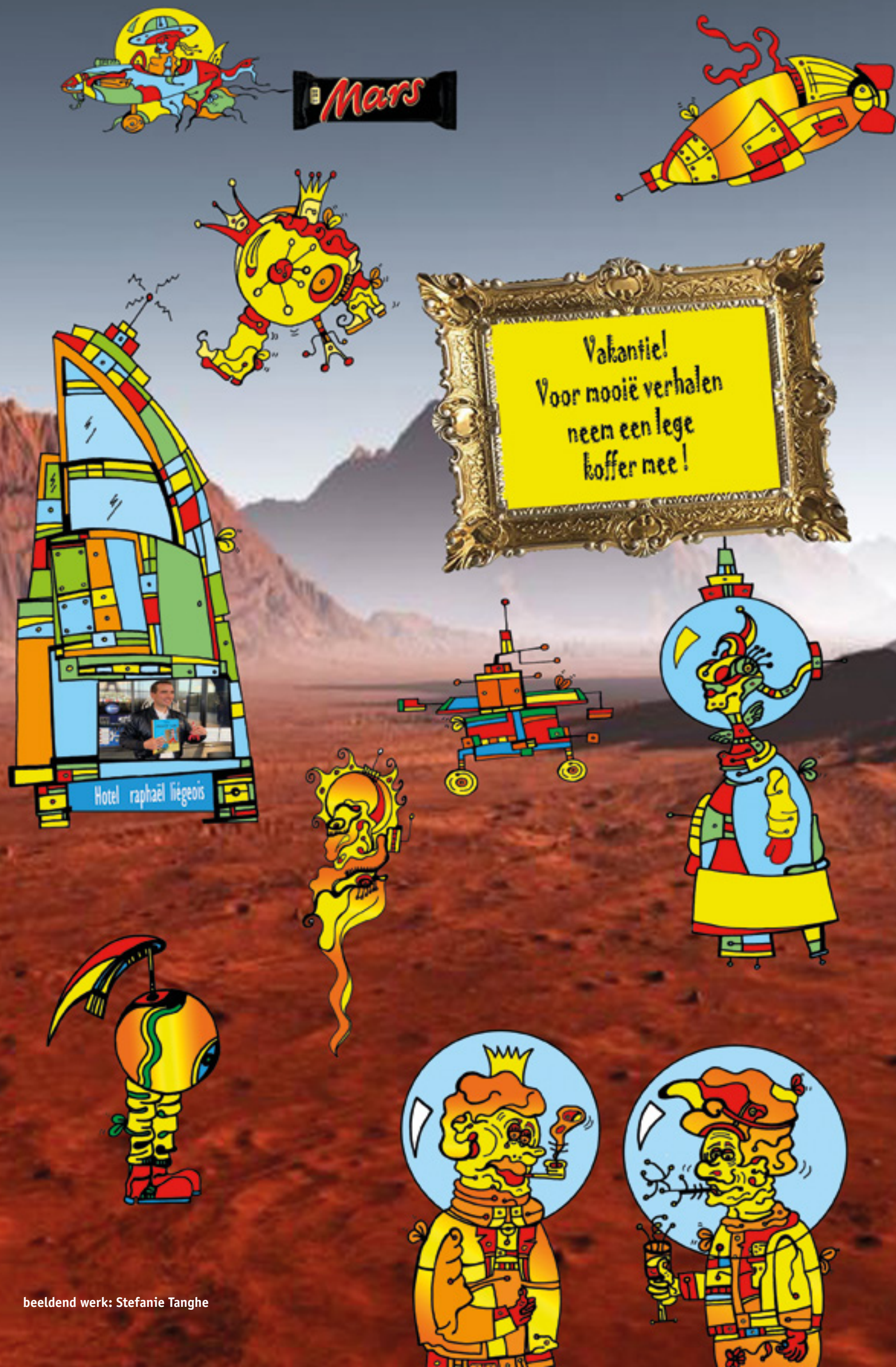
beeldend werk: Stefanie Tanghe