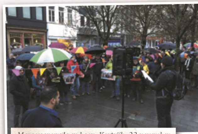
Mars voor vrede en hoop, Kortrijk, 22 november

geïnstalleerd, bijvoorbeeld wat onveiligheid betreft. We weten immers dat de criminaliteit niet stijgt, ondanks wat wordt beweerd. Laat ons niet vergeten dat criminaliteit samen met migratie voor politici het thema bij uitstek is om de macht in handen te houden en te doen lijken of ze enige macht in handen hebben. In beide gevallen is liefde één van de meest concrete alternatieven."